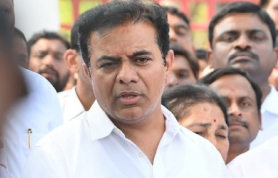
హైదరాబాద్ : టీఎస్పీ వర్కింగ్ సెక్షన్ కేటీఆర్, ముఖ్యమంత్రి రేపంక రెడ్డి ప్రభుత్వంపై తీవ్రస్థాయిలో విమర్శలు చేస్తున్నారని, రాష్ట్రంలో పాతను పూర్తిగా గాలిపోయింది. టీడీపీకి అక్షయంగా కాంగ్రెస్ సర్కార్ పనిచేస్తుంది. తెలంగాణ ప్రజల సొమ్మును దిక్షిలోని గాంధీ కుటుంబానికి తరలిస్తున్నారని సందేహం ఆరోపణలు చేశారు. అదిలాబాద్ జైల్లో ఉన్న యెమ్మారా మహా ఎమ్మెల్యే బాబు సుమన్ ను పరచుకుంటున్న ఆంధ్రప్రదేశ్ కేటీఆర్ మీదయితే మాట్లాడుతున్నారని ప్రకాశం దర్యాప్తు సంస్థలు తెలుస్తూ, రేపంక రెడ్డి గాంధీ కుటుంబానికి - మినా 2 లో