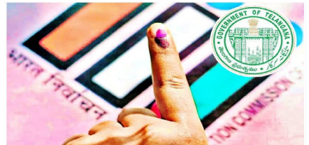
హైదరాబాద్ : బీసీలకు 42 శాతం రిజర్వేషన్లు కల్పిస్తున్న అధికార కాంగ్రెస్ పార్టీ హామీ ఇచ్చిన సంగతి తెలిసింది. దీనిలో భాగంగా బీసీలకు కేటాయిస్తున్న రిజర్వేషన్ల కల్పనపై కేంద్ర ప్రభుత్వం ఏదో ఒకటి తేల్చిన తర్వాత మండల, జిల్లా పరిషత్ ఎన్నికలకు వెళ్లి యోచనలో తెలంగాణ ప్రభుత్వం ఉన్నట్లు తెలుస్తోంది. మంత్రివర్గ సమావేశంలో అధికారిక ఎజెండాపై పరిషత్ ఎన్నికలతో పాటు మరికొన్ని రాజకీయ అంశాలపై చర్చలు జరిగినట్లు తెలిసింది. - మినా 2 లో